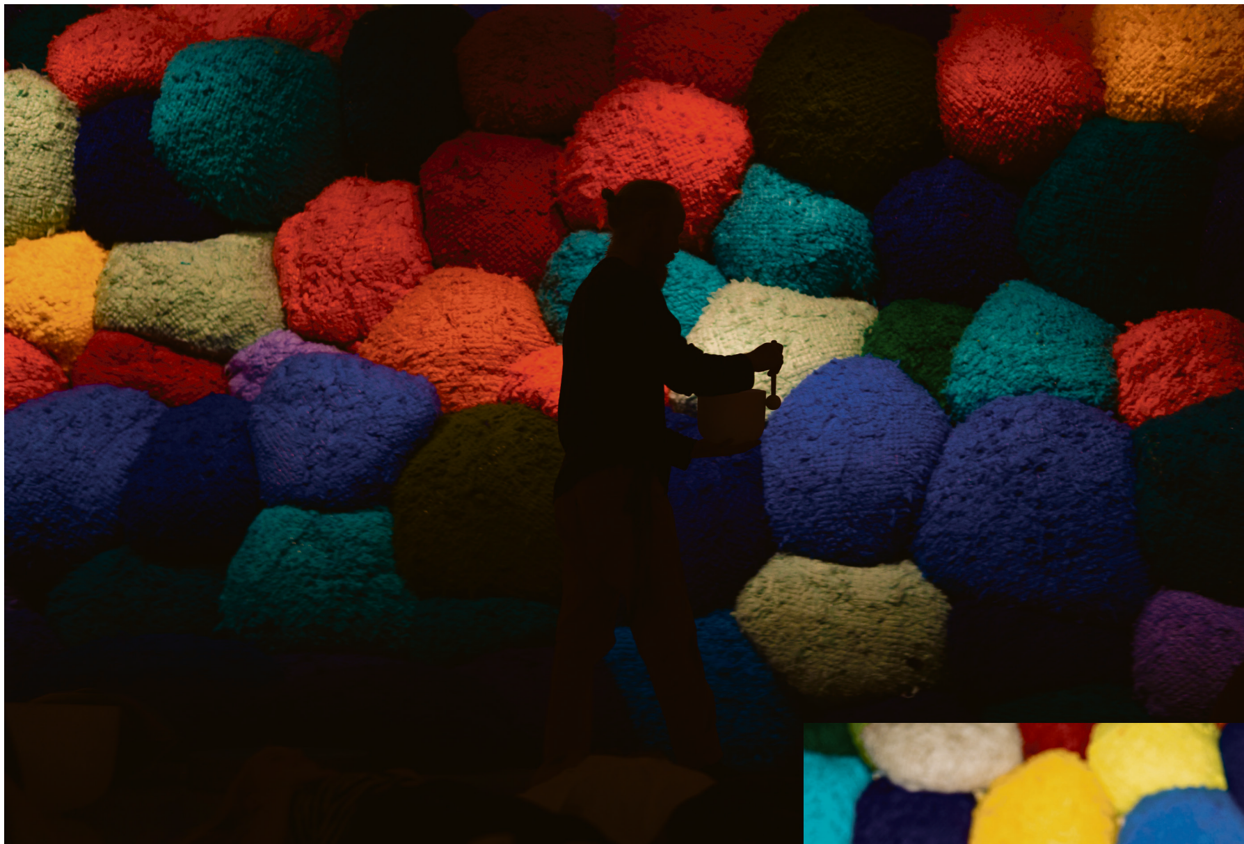
Fargemeditasjon: Nasjonalmuseet hjalp de fremmøtte med å finne fargene i sitt indre øye.

seg klar på dansegulvet. Trinnene styres av musikken – Kalstad får servert house dance-musikk, kan en tilskuer opplyse oss om.