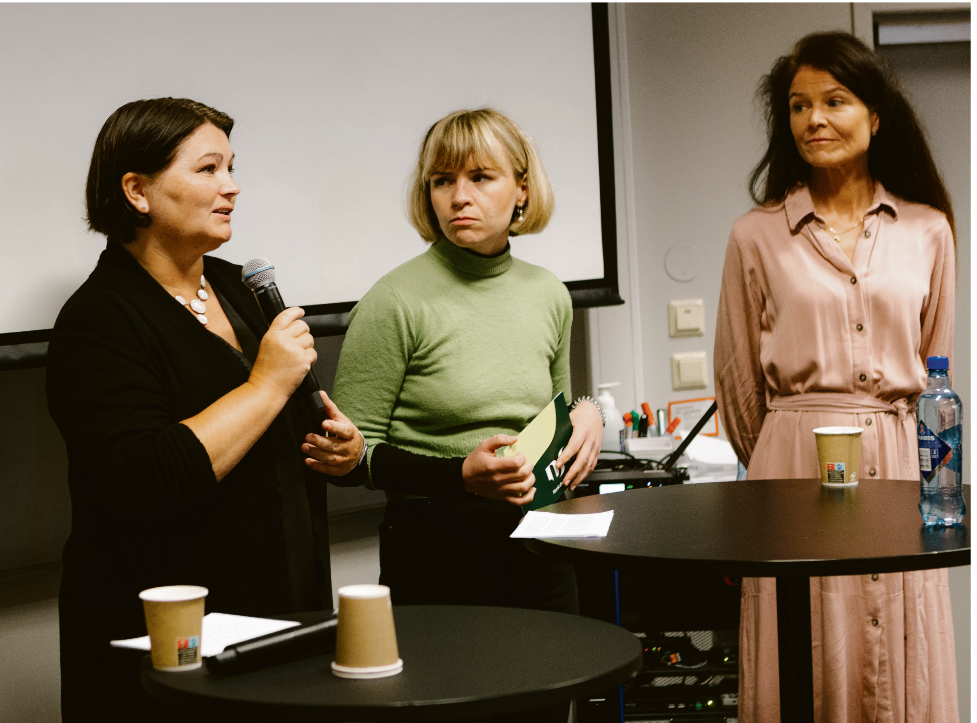
minister Sandra Borch (Sp) er opptatt av å ikke sette studentene i bås.

pingsplan for psykisk helse, sier statsråden til Universitas.