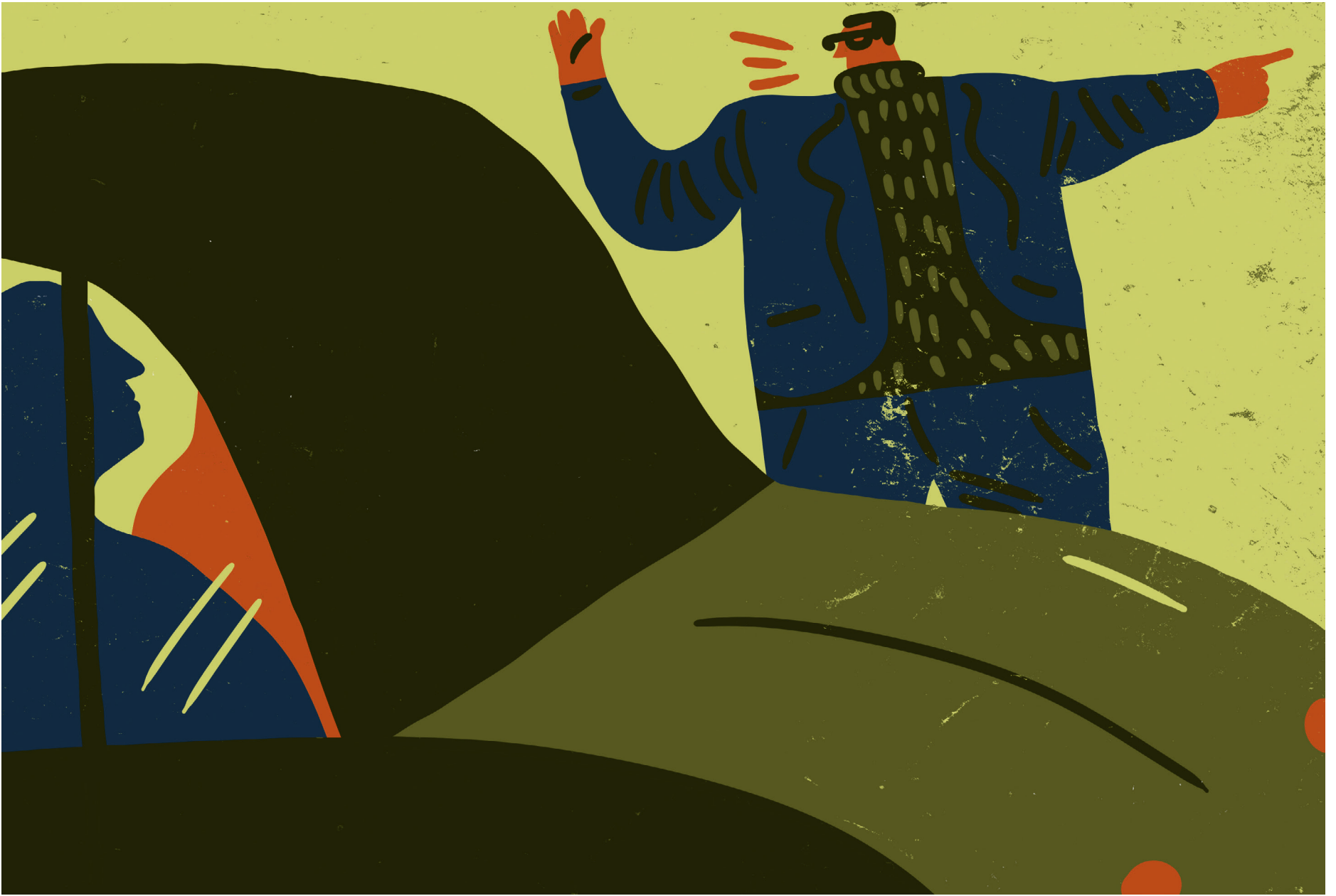
ILLUSTRASJON: OIVIND HOVLAND