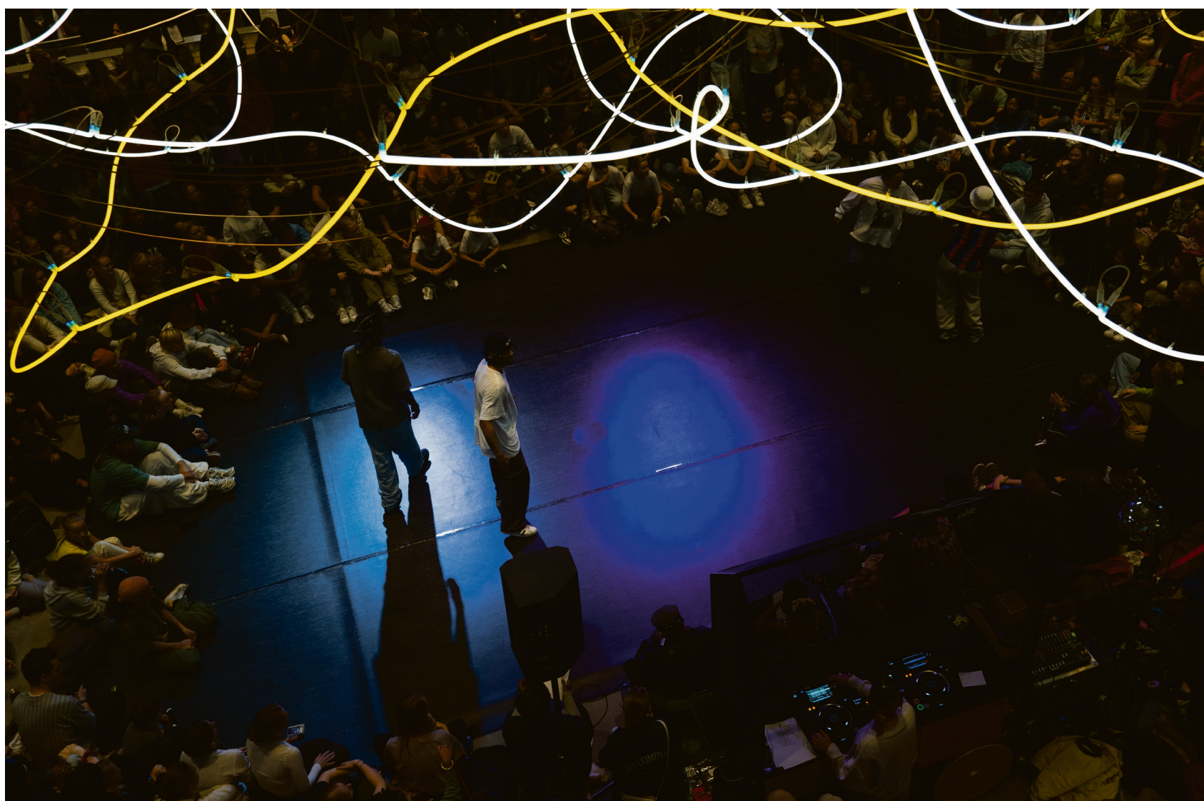
Elektrisk stemning: To par gjør seg klar for dance battle, mens publikum spent heier og hoier før det hele begynner.