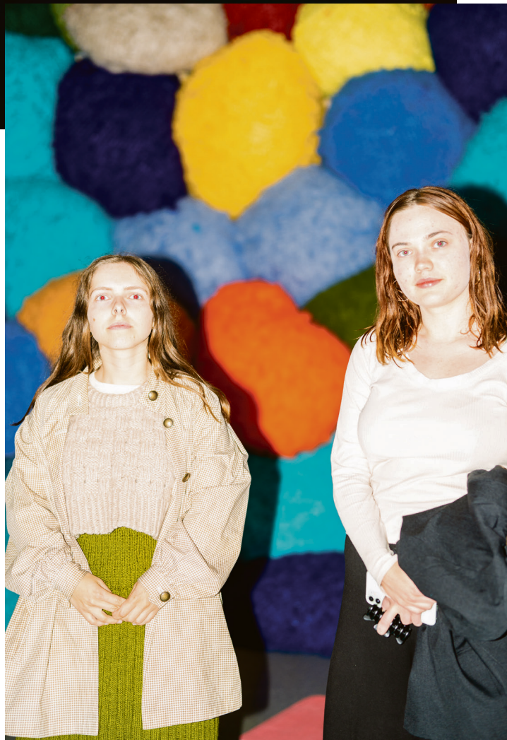
Skeptisk og nyfrelst: Ikke alle lot seg overbevise av fargens meditasjonskraft.

Så bærer turen videre til Stortorvet. Det er duket for opera på trikken.