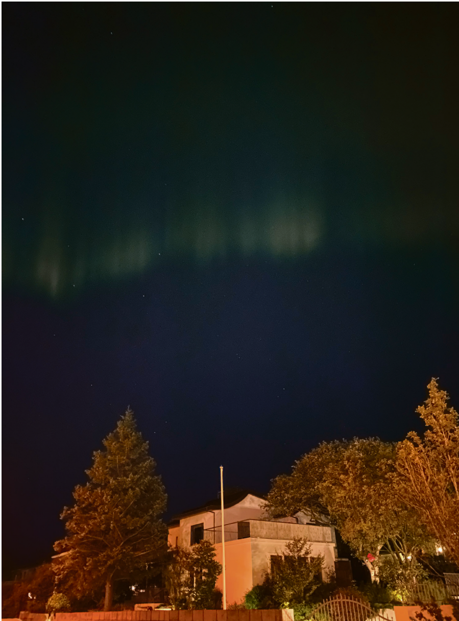
Populær øy: Den nordatlantiske øya fikk besøk av rundt 1,5 millioner turister i 2022.