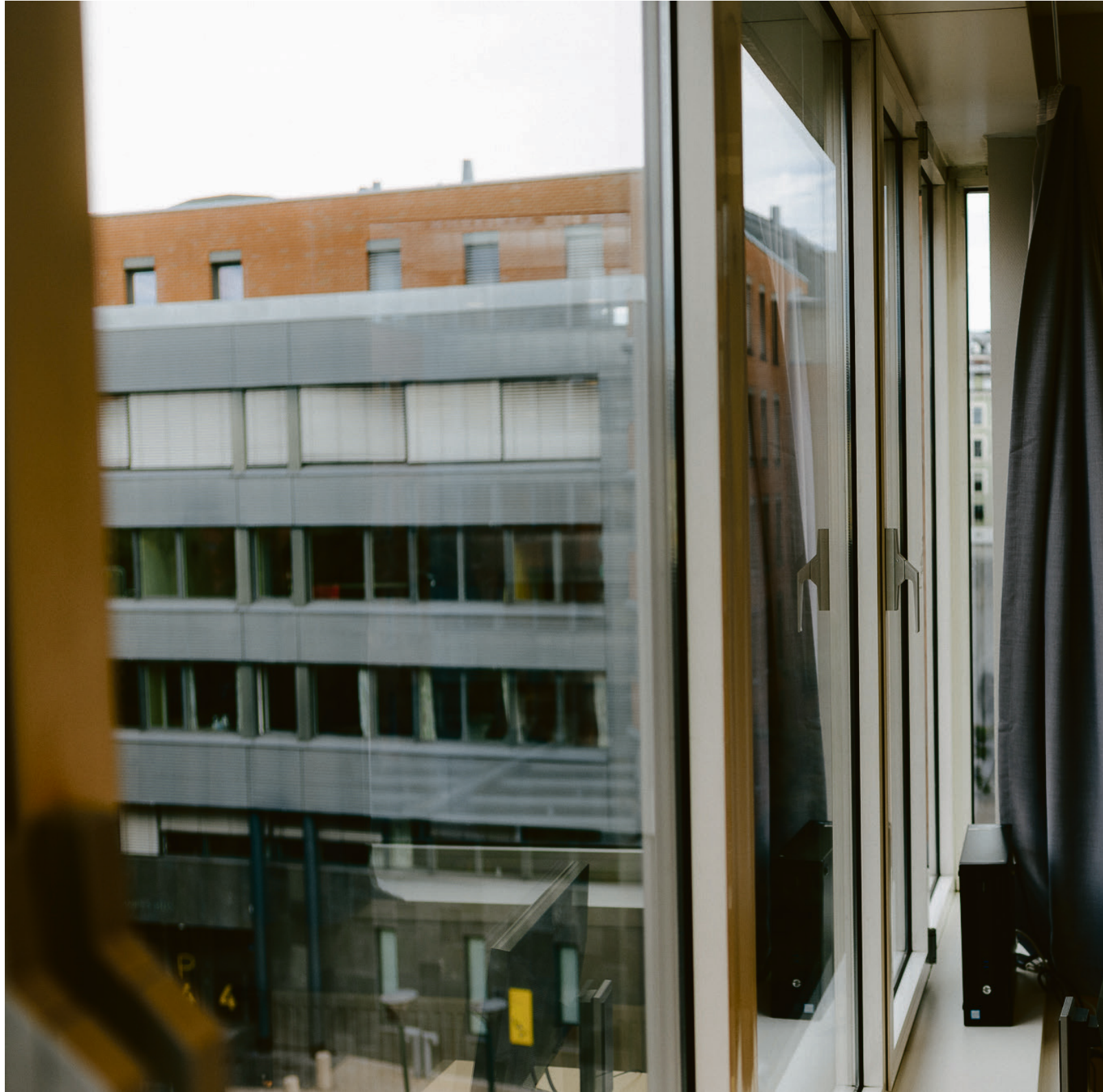
Langt ned: Oslomet bekrefter at flere av vinduene mangler sikring.