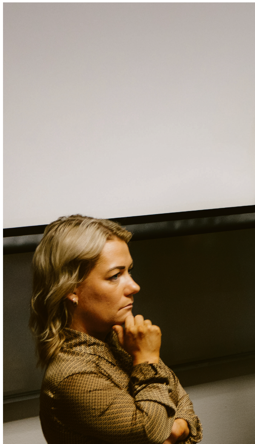
34 prosent: Over én av tre studenter kan ha en psykisk lidelse. Forsknings- og høyere utdannings-