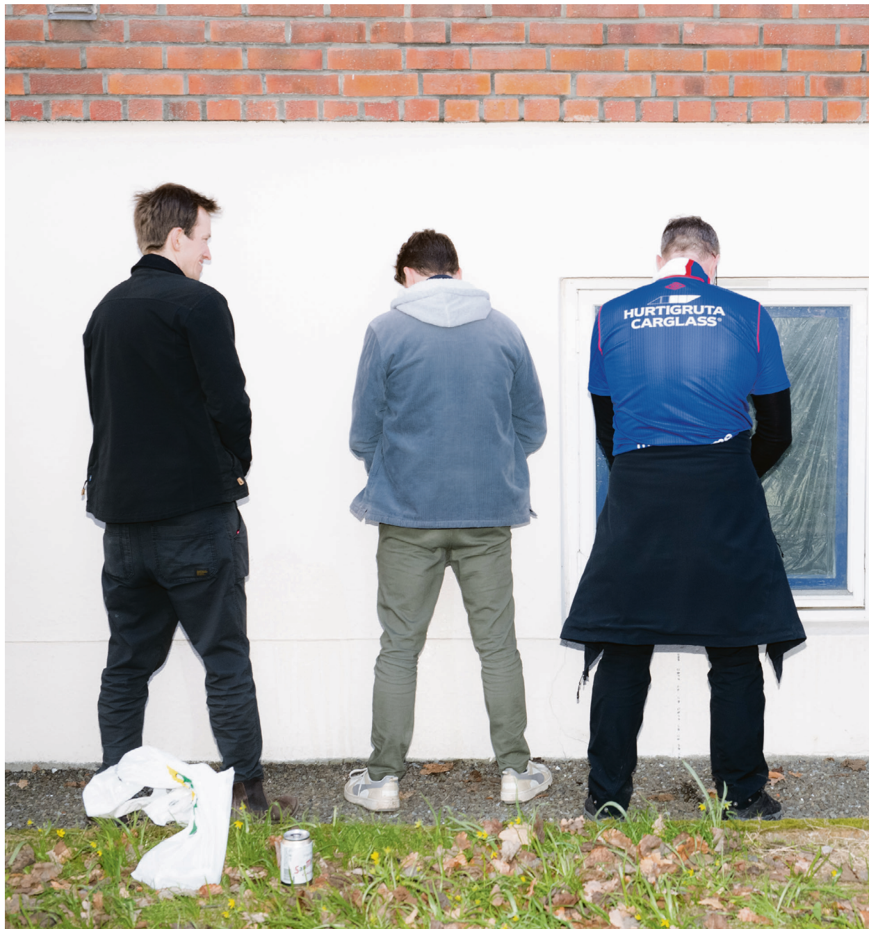
SÅNN PISSER ENGA: Veggene opp mot Ullevål får spylt seg.

– Jeg tror faktisk Lyn kan vinne. Det føles nesten som om det er skrevet i historiebø-