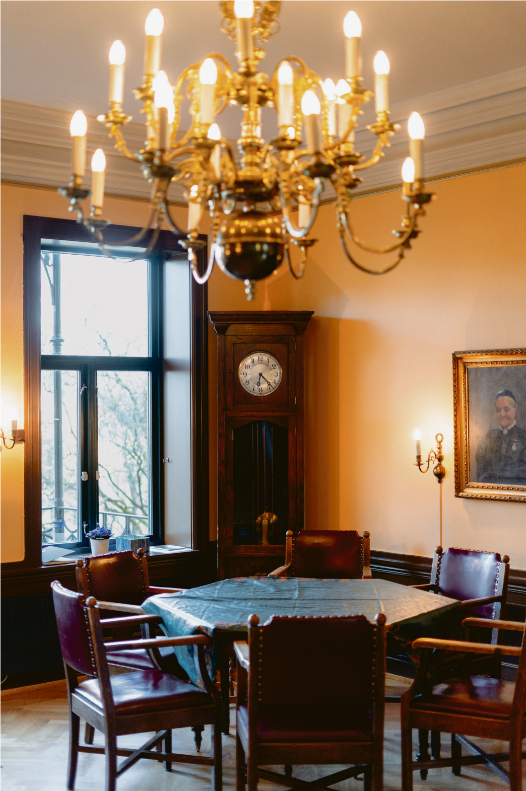
PREKTIG: Det skal ikke stå på interiøret.

denterhjemmet vært bosted til mange kjente navn, deriblant norsklærerfavorittene Arne Garborg og Sigbjørn Obstfelder.