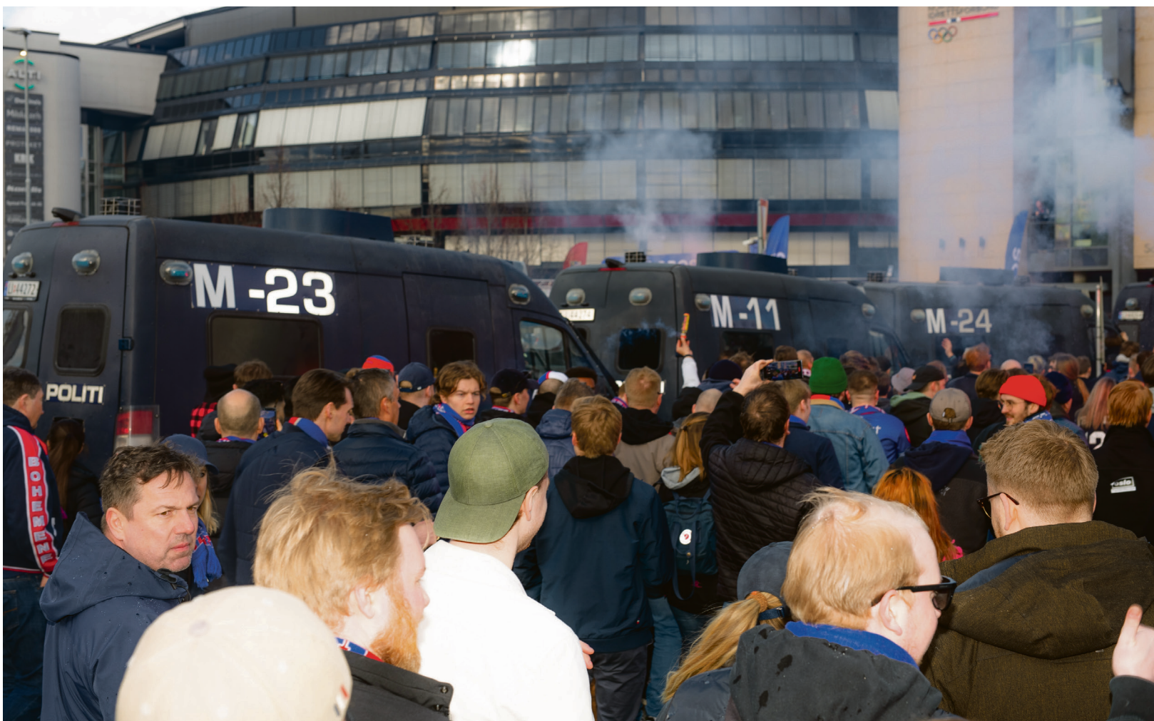
BARNEVAKT: Det er mye politi på plass, når corteoen ankommer Ullevål.

Og det virker faktisk som om Torgrimssønns forbannelse ble brutt under hatoppgjøret mot Lyn.