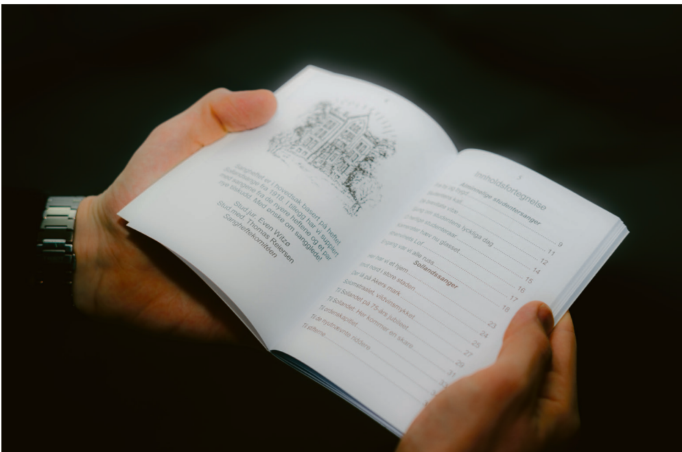
ALLSANG: Når beboerne møtes, stemmes det ofte opp til sang.