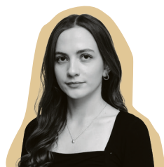
ANSVARLIG REDAKTØR Alida de Lange D'Agostino