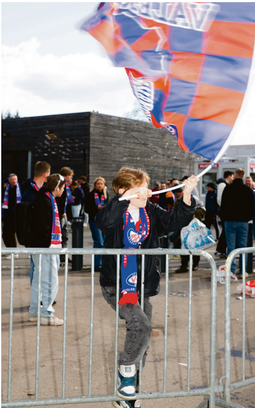
PÅ BARRIKADENE: Som supporter må man stolt bære lagets fane.

for å kontrollere supporterne de nå skal loses inn på stadionen.