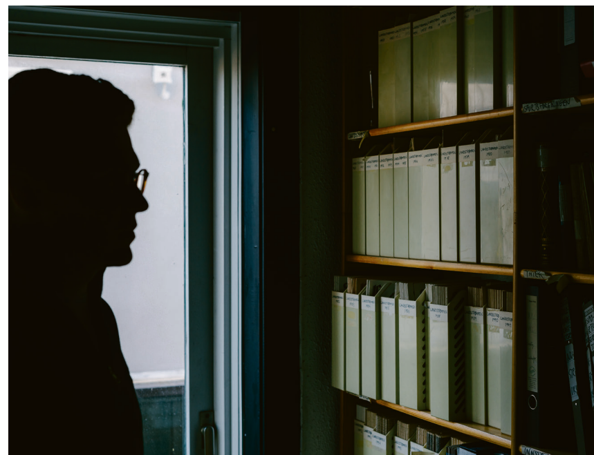
OVERSIKT: På arkivrommet kan man finne det meste. Her er alle utgaver av Studentehjemmets avis og resultater fra spillet Thier .