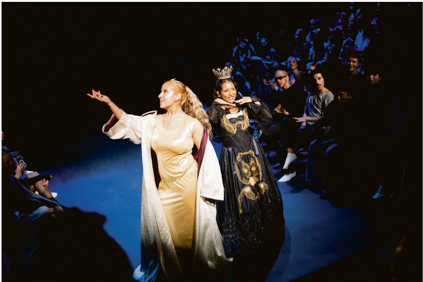
SOM DERE VIL HA DET: På ballet er all tematikken inspirert av Shakespeares verk.