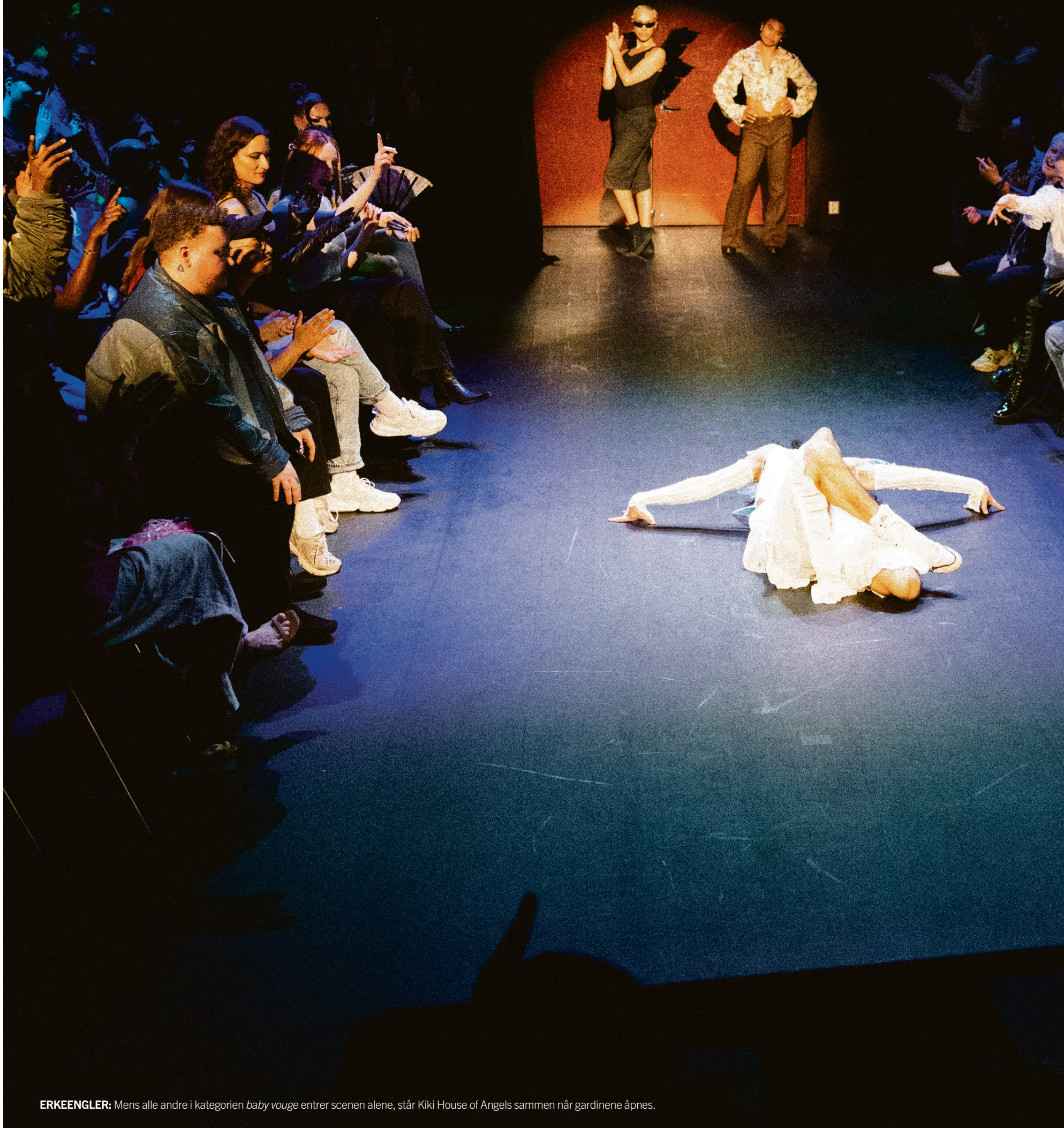
ERKEENGLER: Mens alle andre i kategorien baby vouge entrer scenen alene, står Kiki House of Angels sammen når gardinene åpnes.