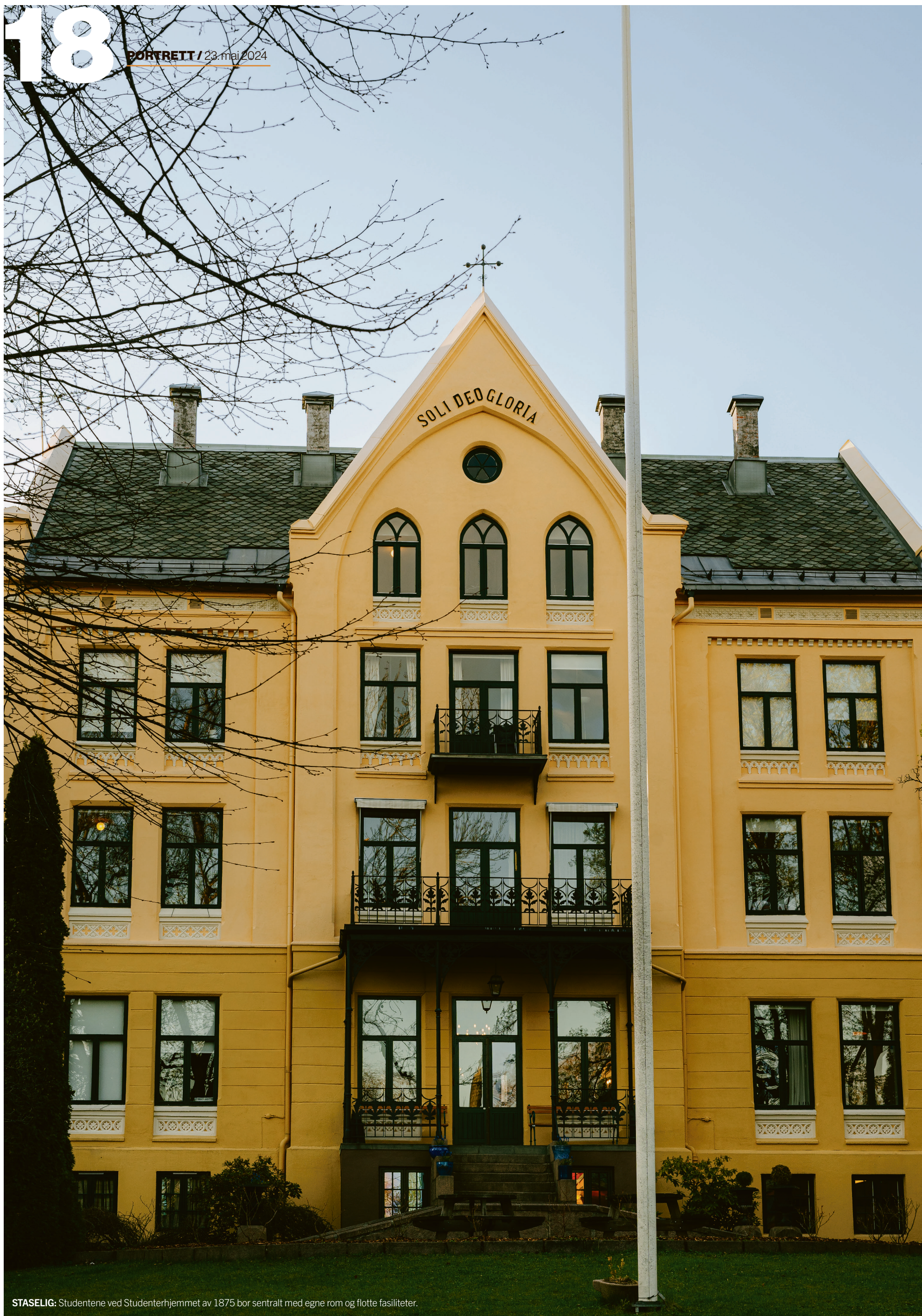
STASELIG: Studentene ved Studenterhjemmet av 1875 bor sentralt med egne rom og flotte fasiliteter.