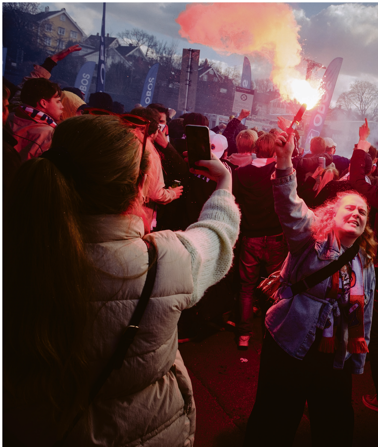
BASTIONEN I FLAMMER: I siste time før avspark var det mildt sagt full fyr utenfor Ullevål stadion.