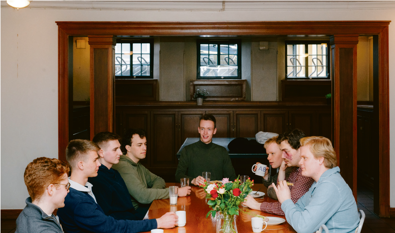
TETTE BÅND: Selv uten alkohol, er det rikelig med latter og stemning i Studentehjemmet.

sen på og skoene blir blankpusset. Da skal man diskutere måneden som har gått, og utgi månedens avis, Strømmen . Med talerstol og slips skal både formaliteter og fjas diskuteres med blodigste alvor. Men frykt ikke - dette er ikke noen frimurerlosje. Selv om møtene kan virke overdådig, er det meste med et glimt i øyet.