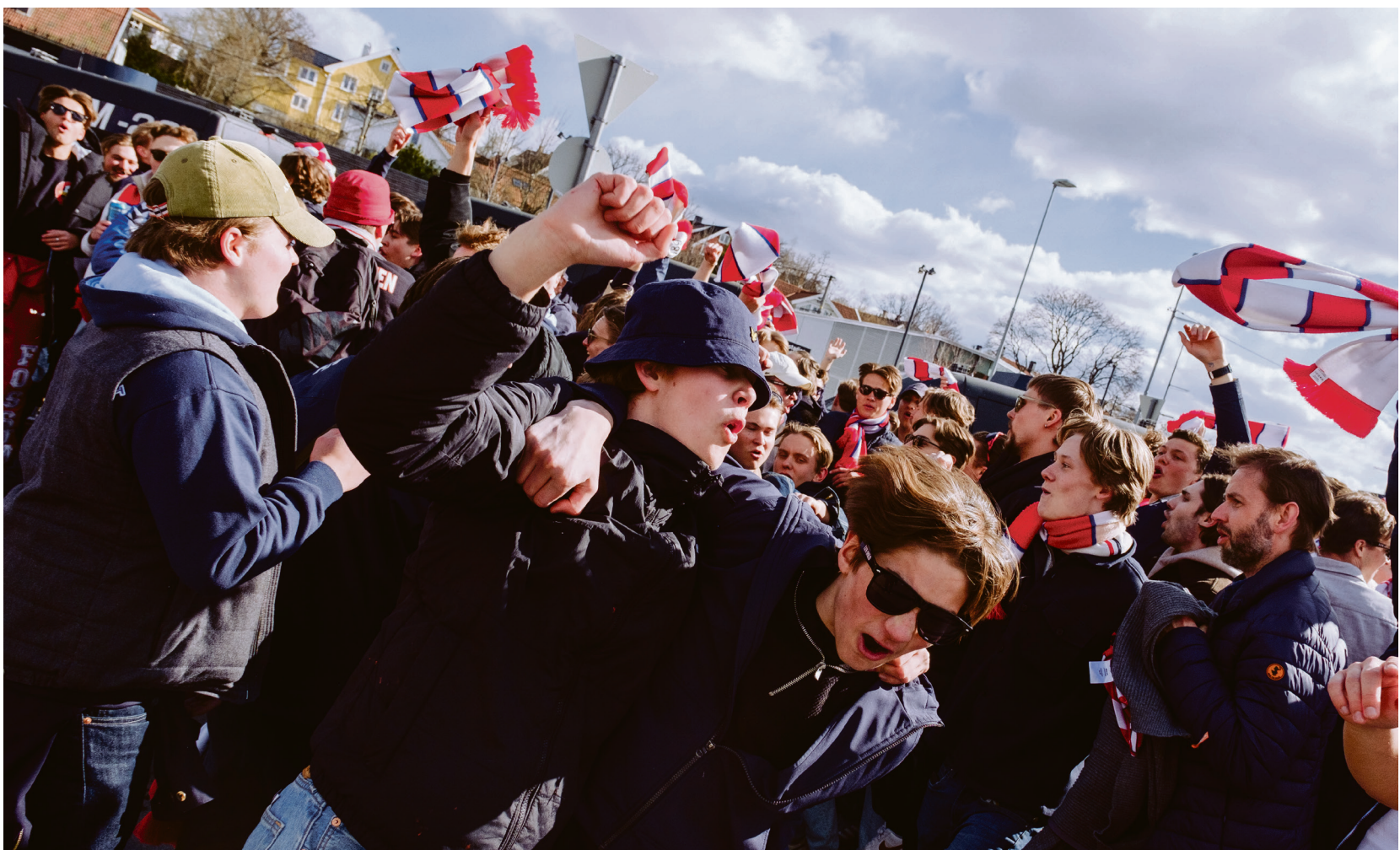
KRAMPERUSS: Turen opp til Ullevaal tar oss tilbake til rulling i russetiden.