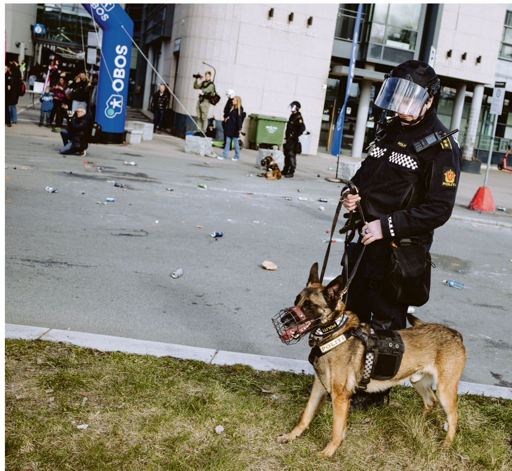
SNILL BISK: Politiet brukte mye ressurser på sikkerhet for anledningen.