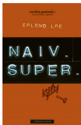
Naiv, Super (1996) av Erlend Loe

tekst: ELENA BERG HANSEN • foto: TOBIAS SCHILDMANN MANDT