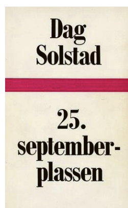
25. septemberplassen (1974) av Dag Solstad

Det var den første boken jeg leste som betydde mye. Jeg gikk på ungdomsskolen, og når jeg ser tilbake, tror jeg ikke jeg forsto den helt. Jeg reflekterte ikke så mye rundt det indre følelseslivet og hva boka egentlig beskriver. Men det jeg forsto, var at den var rett frem og annerledes. Det var forfriskende. Jeg tror jeg tenkte: «Oi, er det lov å skrive så enkelt? Og at folk enda kunne like det». Boka har nok formet meg med tanke på å tørre å skrive musikk. Jeg gikk på musikklinja på videregående, hvor det alltid var fokus på å være flink og at ting skulle være avansert. Jeg dras veldig mot dem som tør å gjøre ting enkelt.