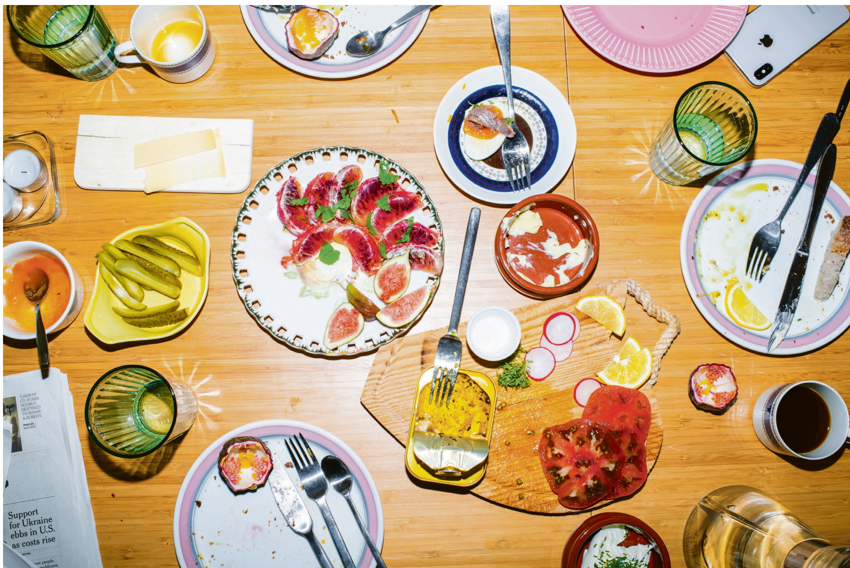
Nedpå-mat: Tilbakelemt og tilgjengelig er ordene ekspertene bruker på å definere maten som florerer på sosiale medier og dagens hippeste spisesteder.

med fersk bakst, en bedre ost og godt smør – gjerne med naturvin eller kombucha i glasset.