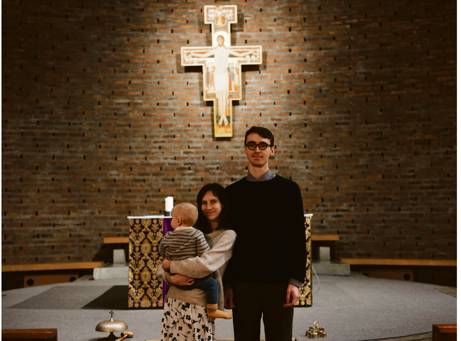
Nytt liv: For August handler det å være gift om å forenes under Gud. Å skape nytt liv er også helt sentralt i ekteskapet, forteller han.

ikke det nå heller, men det var noe som holdt meg tilbake. Og det som ledet meg inn i det var veldig impulsive følelser og en slags forelskelse.