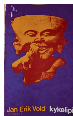
Kykelipi (1969) av Jan Erik Vold

Dette er den siste boka jeg leste i en boksirkel jeg er med i, og jeg likte den kjempegodt. Den er veldig mørk, og handler om en mann som egentlig bare er helt nihilist. Han har gitt opp og mener det ikke er noe mening med livet, så han har startet et prosjekt som kun er selvutslettende. Også er den i tillegg ganske drøy. Houellebecq er jo kontroversiell, veldig ufiltrert på en måte. Men jeg synes den mørke håpløsheten er appellerende. De gangene jeg har lest bøker de siste ti årene, har jeg ofte valgt norske, kvinnelige forfattere. Dette er noe veldig annet. Det er noe forfriskende med et helt annet perspektiv og annen skrivestil.