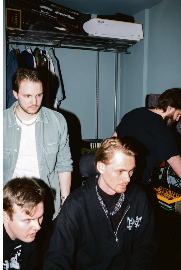
Gjør-det-selv-mentalitet: Musikkollektivet Flux ble etablert under pandemien. I en moderne leilighet på Grønland mikser de låter og planlegger klubbarrangementer sammen.