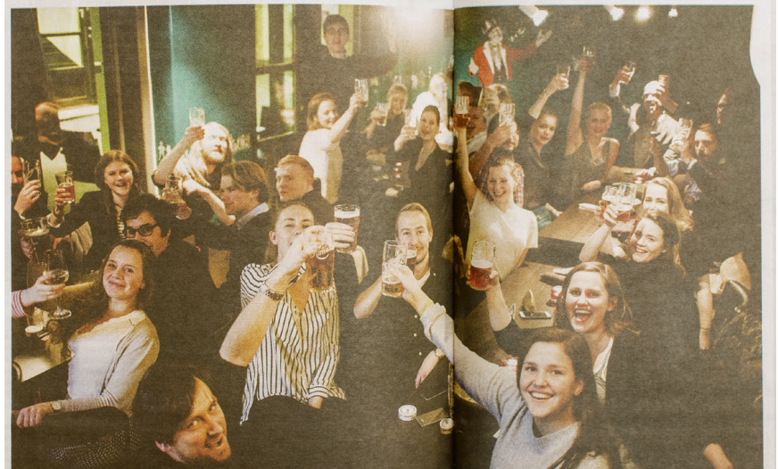
Universitas utg. 33 2015