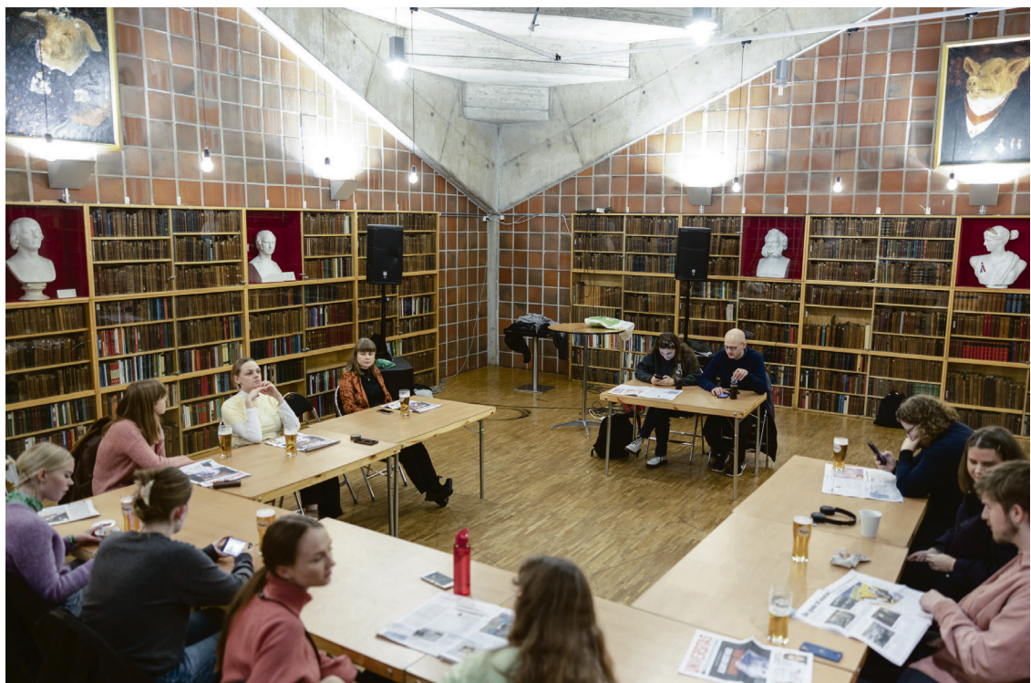
Hans Majestet Grisen: Chateau Neufs maskot overvåker redaksjonsmøtet.