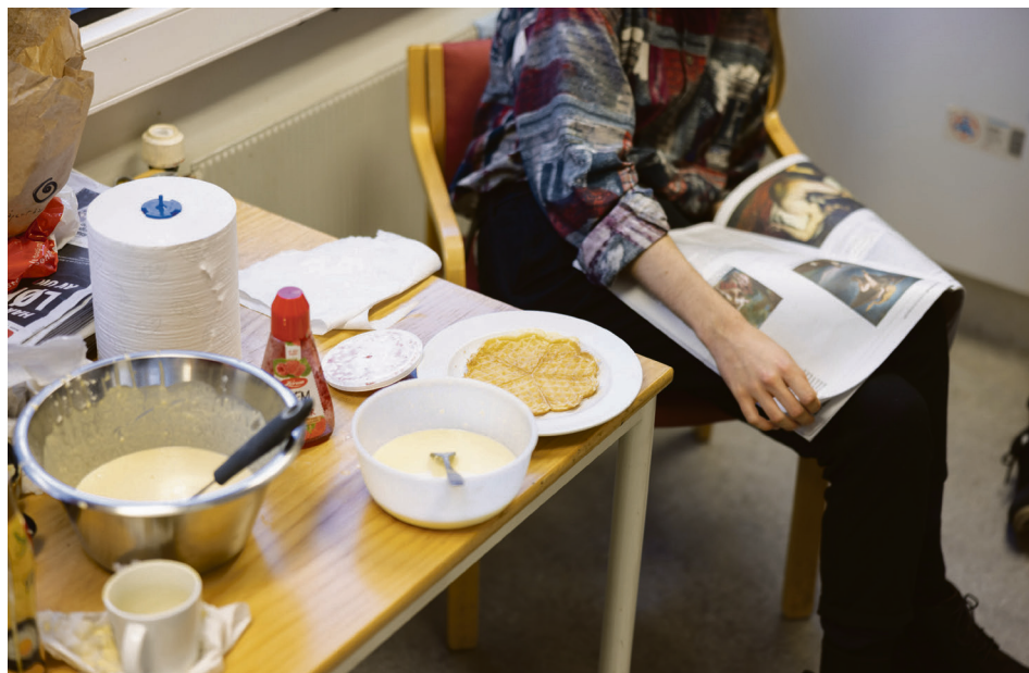
Mandag klokka tre: To rører og Morgenbla' for i går

Hvordan blir en avis til? Vær med som flue på veggen under en uke med redaksjonen.