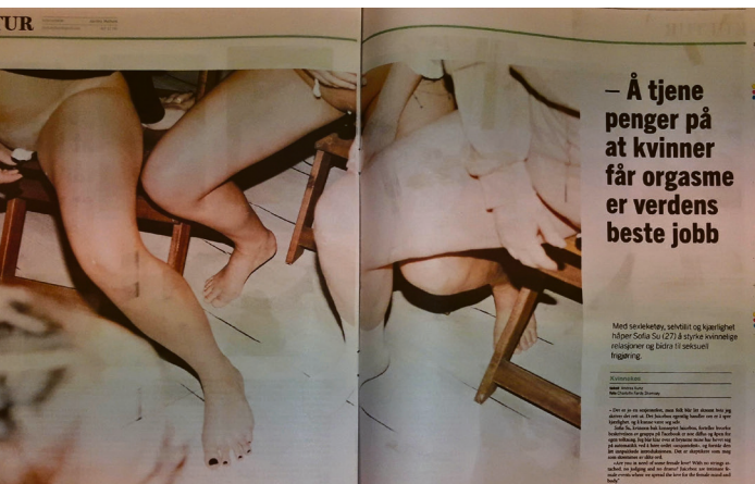
Universitas utgave 9 2019