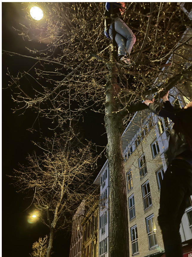
Nøtteliten: Høyt henger de, og blide er de.