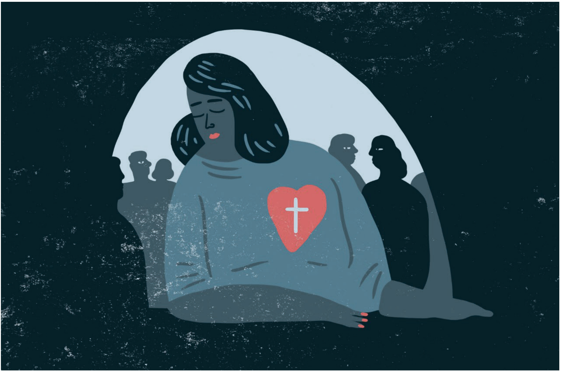
ILLUSTRASJON: ØVIND HOVLAND

som skjer rundt meg. Troa mi er hvem jeg er. Det er bakgrunnen min og verdensbildet mitt. Den er kjempeviktig for meg.