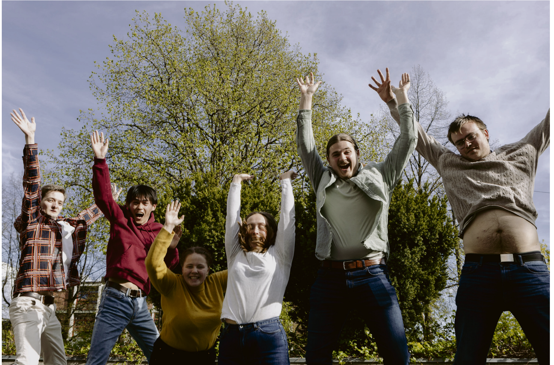
Jubler: Venstrealliansen har vunnet studentvalget ved UiO for sjetteåret på rad. Det jubler de for på Studentparlamentets valgveke på Chateau Neuf.

Venstrealliansen gikk av med seieren i årets studentvalg, mens en comeback-liste spiste av oppslutningen til de andre.