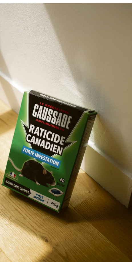
Smartmus: Musa som bor med Rudsar og Sollid, har de ikke klart å drepe. De har konkludert med at den er for smart.