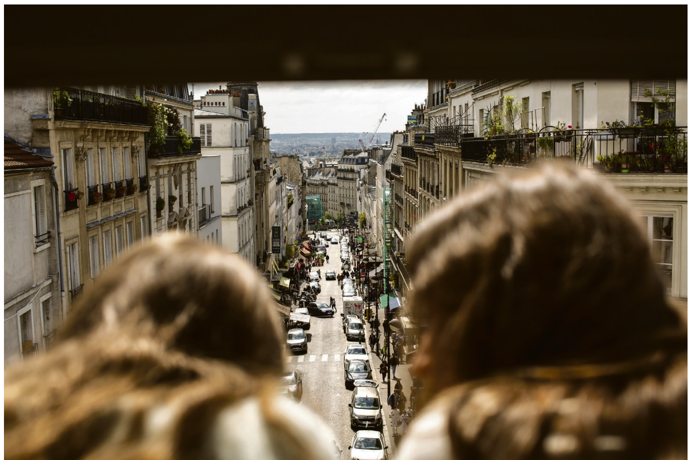
Trangt inne, lyst ute: Ineke Feen Rudsar og Aurora Sollid leier en etterroms leilighet gjennom Airbnb. I blant sitter de ved vinduet, til tross for at det såvidt er plass til begge to.