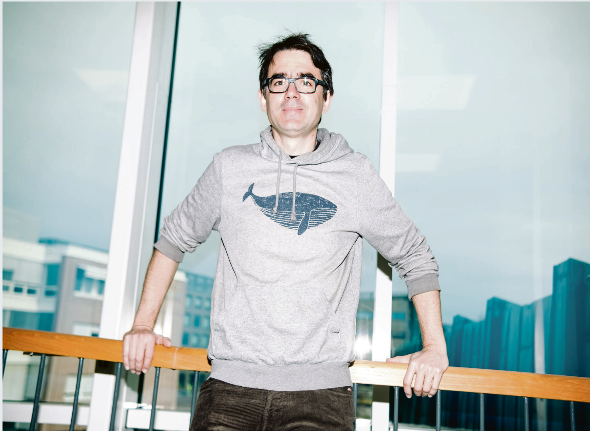
Den neste krisa: – Det å få folk ut av fattigdom og vanskelege leveforhold er den beste måten for å få folk til å vere meir motstandsdyktige for den neste krisa, seier professor i psykologi ved UiO Tilmann von Soest.